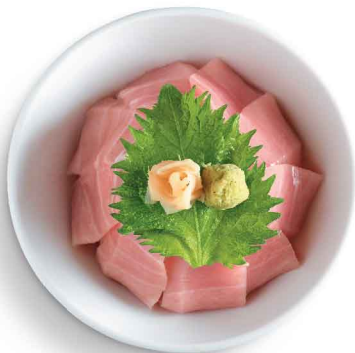
とろ井 拖羅井 Toro Don

Served with salad, toro (3 pcs), side dish and wafu soup