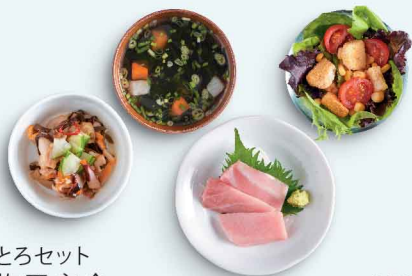
とろセット 拖羅定食 Toro Set