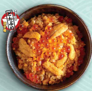
食堂丸善 うにめし丼