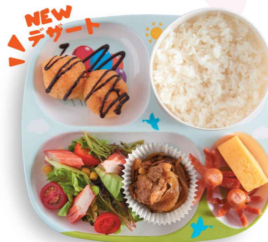
和風焼き牛肉プレート 和風牛肉定食 $65 Japanese-style Grilled Beef Plate

オレンジジュースまたはリンゴジュース付き 配橙汁或蘋果汁 Served with Orange Juice or Apple Juice