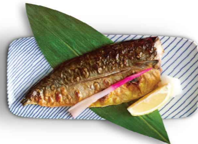
鯖の塩焼き (ご飯付き) 鹽焼鯖魚 (配飯) Salt-grilled Mackerel (Served with Rice) $70