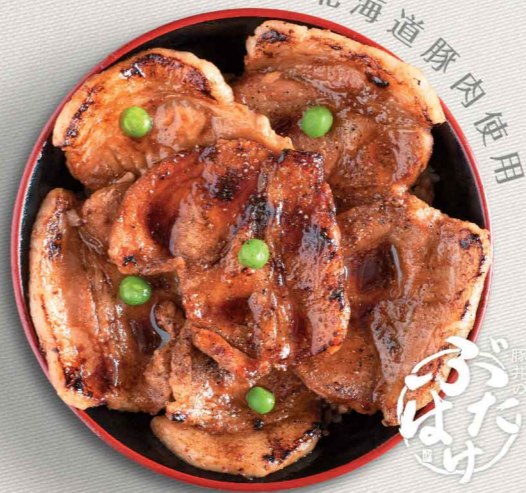
十勝帯広名物豚丼 並盛/R $88 十勝帯廣名物豚丼 特盛/L $108 Obihiro Butadon

名物丼人氣No.1定番之選！源自北海道十勝著名豚丼專門店「豚丼のぶたはげ」，嚴選北海道豚肉，配以其傳承八十多年的秘製醬汁及正宗日式烤法烹製，令豚丼香味四溢，每一口都盡是滿足。