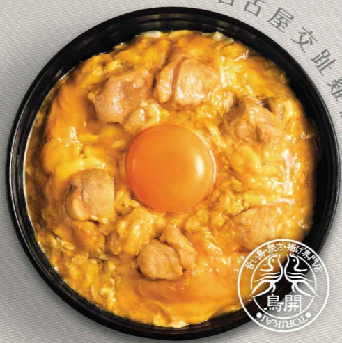
名古屋コーチン親子丼 $83 名古屋鳥開親子丼 Nagoya Cochin Oyakodon

由名古屋的雞肉料理專門店「鳥開」親自監製，選用日本三大名種地雞之一的「名古屋交趾雞」及嚴選新鮮雞蛋炮製的親子丼，以口感厚實富彈性、味道香濃的雞肉，及自家製鰹魚高湯烹製而成的香甜滑嫩半熟蛋汁盡盡人氣。