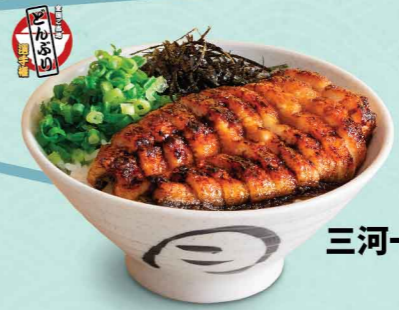
鰻まぶし屋 三河一色産鰻まぶし丼