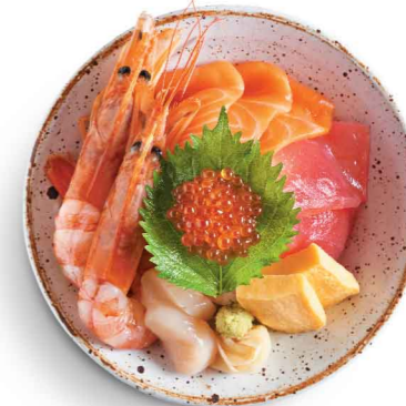
新 特大赤エビ海鮮丼 特上盛大蝦海鮮丼 $128 Jumbo Red Shrimps and Seafood Don