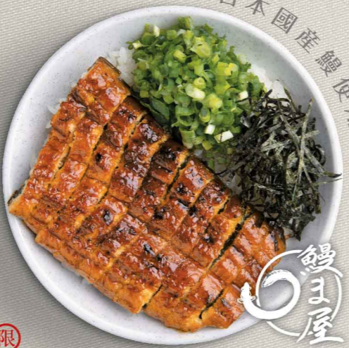
三河一色産鰻まぶし丼 $158 三河一色産鰻魚三味丼 Grilled Mikawa Isshiki Eel Don

嚴選來自日本中部知名養鰻地區愛知縣三河灣一色町的鰻魚，鰻魚味道上品，肉質柔軟、油脂均勻，被視為鰻魚中的王樣。