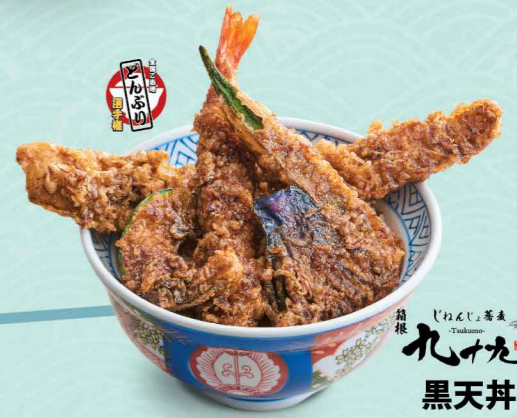
箱根 九十九 黒天丼