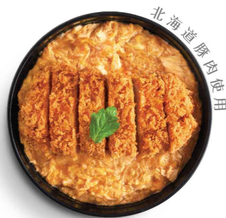
北海道豚肉使用 カツ丼 滑蛋吉列猪扒丼 $98 Katsudon