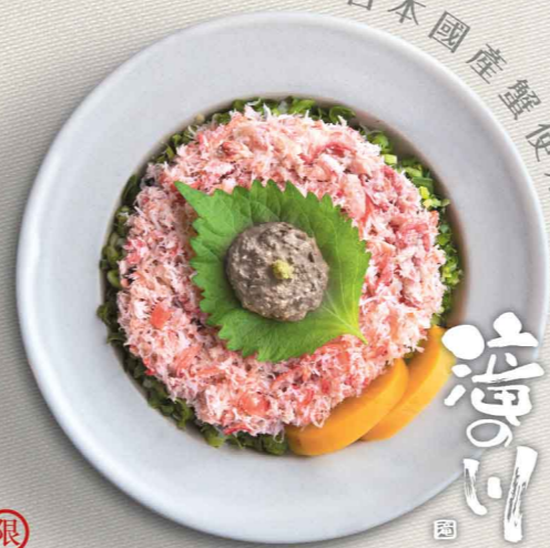
滝の川監修蟹丼 $178 滝の川監修蟹丼 Takinokawa Kanshu Kani Don

嚴選來自日本的蟹，蟹肉質感纖細、鮮味滿溢，配合福井縣的蟹料理專門店「滝の川」特製的香濃蟹味噌品嚐，並親自監修，實在不容錯過。