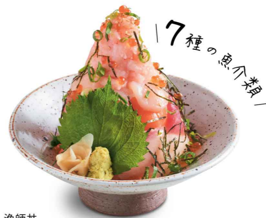
新 漁師丼 漁師丼 Fisherman's Seafood Don