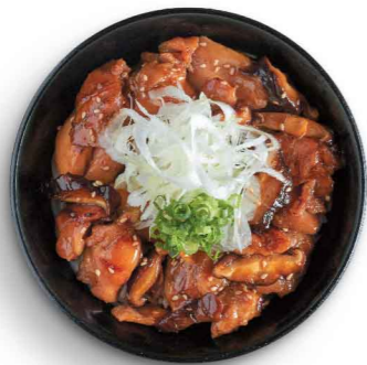
炭火焼き鶏丼 炭焼鶏肉丼 Sumiyaki Chicken Don $58