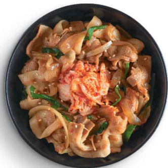
豚キムチ丼 豚肉泡菜丼 Pork Kimchi Don $65