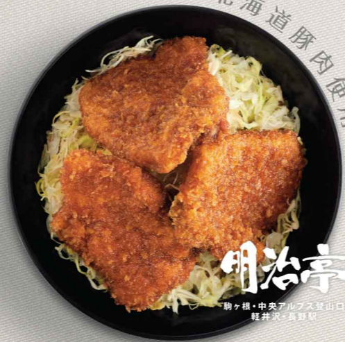
信州風味ソースカツ丼 $88 信州風味醬汁吉列豚丼 Shinshu-style Sauce Katsudon

醬汁源自長野縣醬汁吉列豬扒丼專門店「明治亭」，每日由職人以十二種嚴選材料謹製而成，風味獨特。造訪輕井澤、長野駅、駒根等地時，不容錯過明治亭。