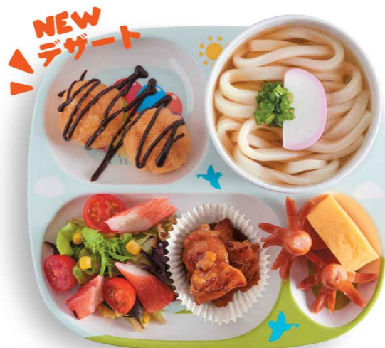
鶏の炭火焼きプレート 炭焼鶏肉定食 $65 Sumiyaki Chicken Plate