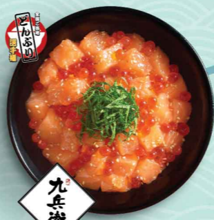
九兵衛 とろサーモン といくらの親子丼