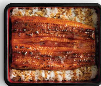
うなぎ鰻重 Eel Rice Box $98