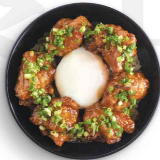
唐揚げ丼 温泉玉子のせ 唐揚鶏丼配温泉玉子 Karaage with Poached Egg Don $65