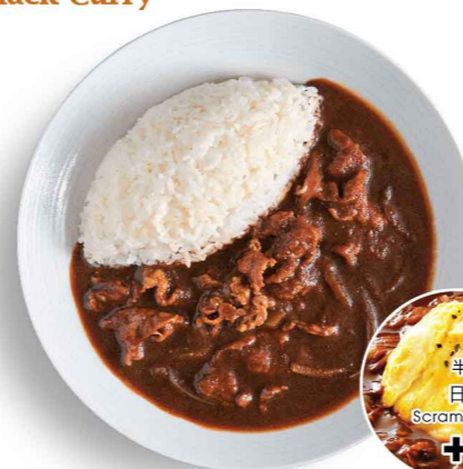
ビーフ牛肉飯 Beef Rice $70