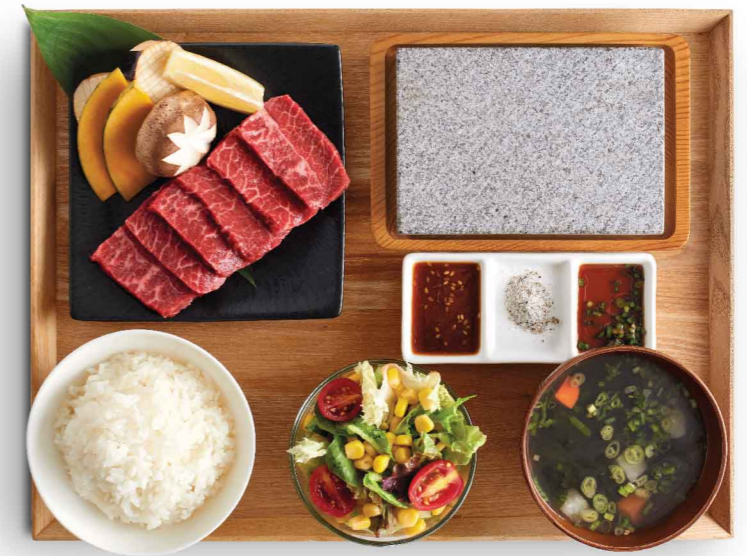
和牛石焼きセット 和牛石焼定食 Wagyu Stone Grill Set