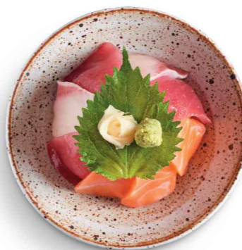
三色海鮮丼 (サーモン、マグロ、ハマチ) 三色海鮮丼 (三文魚、吞拿魚、油甘魚) $83 Assorted Seafood Don (Salmon, Tuna, Hamachi)