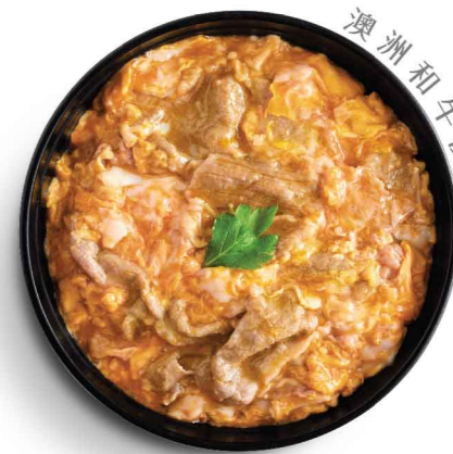
澳洲和牛使用 和牛とし丼 滑蛋和牛丼 $78 Wagyu with Egg Don