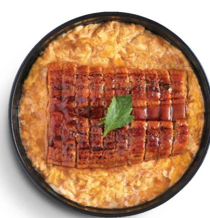
うなとし丼 滑蛋鰻魚丼 $118 Eel with Egg Don