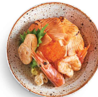
炙り海鮮丼 (海老、ホタテ、サーモン、とびっこ) 炙焼海鮮丼 (大蝦、帆立貝、三文魚、飛魚籽) $88 Seared Seafood Don (Jumbo Red Shrimp, Scallop, Salmon, Flying Fish Roe)