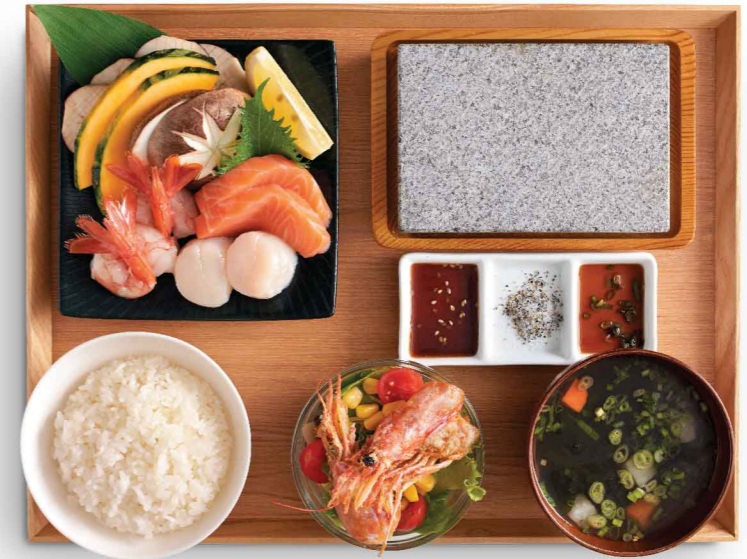
海鮮石焼きセット 海鮮石焼定食 Seafood Stone Grill Set