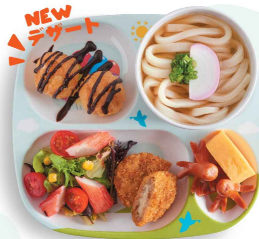
花畑牧場 ラクレットチーズメンチカツプレート 花畑牧場 芝士豚肉薯餅定食 $65 Hanabatake Pork Raclette Cheese Minced Cutlet Plate