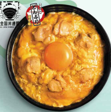
名古屋コーチン 親子丼