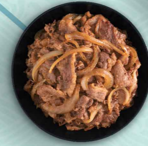
青森名物 十和田 バラ焼き丼