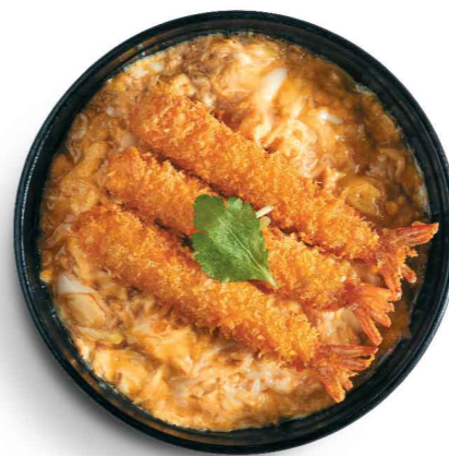
新 エビフライとし丼 滑蛋吉列大蝦丼 $78 Deep-fried Jumbo Shrimps with Egg Don