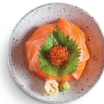
サーモンいくら丼 三文魚親子丼 $95 Salmon and Salmon Roe Don